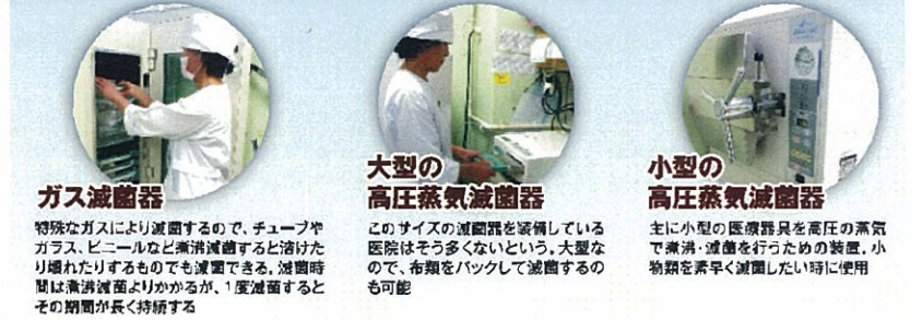
ガス滅菌器 特殊なガスにより滅菌するので、チューブやガラス、ビニールなど滅菌滅菌すると溶けたり膨れたりするものでも滅菌できる。滅菌時間は滅菌温度よりかかるが、1度滅菌するとその期間が長く持続する。